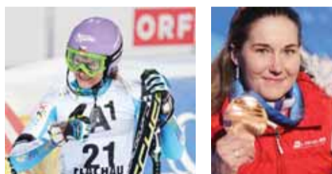
Šárka Strachová – Záhrobská

Třetí v anketě sjezdářka Šárka Strachová – Záhrobská, mistryně světa ve slalomu. Na zimních OH 2010 ve Vancouveru dojela na třetím místě a obdržela tak první českou olympijskou medaili ze sjezdového lyžování po 26 letech.