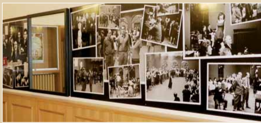
Reprodukcja fotografii z wnętrza westybulu domu kultury Střelnice.

Na ekrany czeskich kin film wszedł parę tygodni przed sierpniem 1968 r. (inwazja wojsk Układu Warszawskiego na Czechosłowację – przyp. tłum.). Podczas gdy za granicą wiodło mu się dobrze również w okresie najtwardszej normalizacji (poinwazyjne prześladowania – przyp. tłum.), w Czechosłowacji powędrował na półkę. Ówczesni towarzysze uznali, że twórca nasmiewa się z klasy robotniczej. Ostatecznej egzekucji nad filmem mieli dokonać vrchlabscy strażacy, ci jednak podczas projekcji weselo rechotali. Zachwyceni byli już podczas samego kręcenia. Dostawali honorarium 29 koron czechosłowackich, a do tego czuli się niczym gwiazdy filmowe. Film zdobył nominację do Oscara, a dla Miloša Formana stał się biletem do Ameryki.