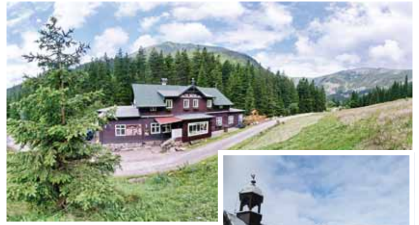
abgelegenen Orten haben sie oft existenzielle Probleme“, ergänzt der Bürgermeister.